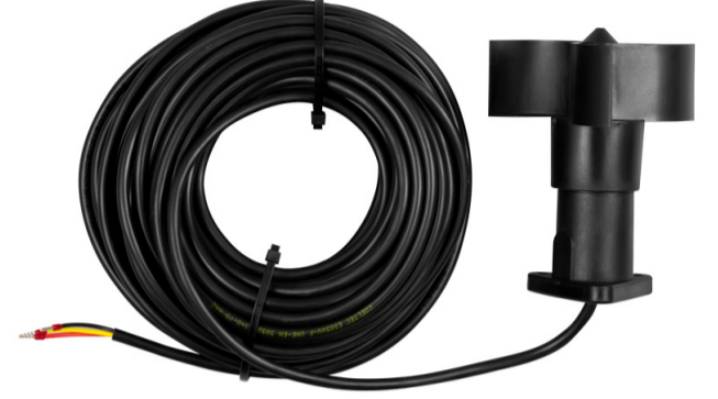
Akış Hızı Ölçer PCE-WS V

Sabit kurulum / Çeşitli çıkış sinyali / Rüzgar uyarı sistemleri, ev teknolojisi ve bina otomasyonu için