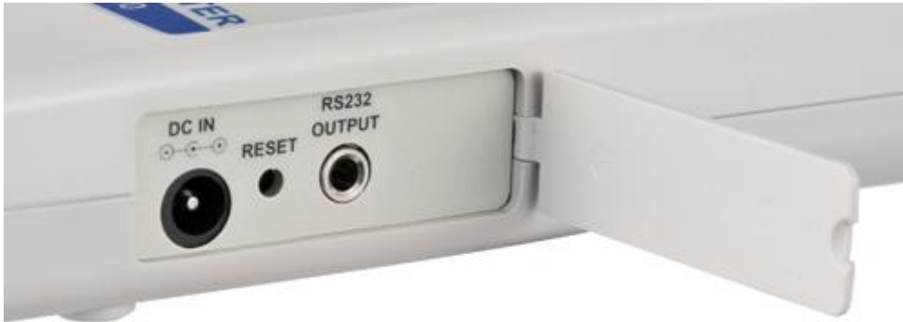
Hier sehen Sie die Anschlüsse für die optional erhältliche Software und das Netzteil