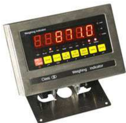
Display della bilancia da pavimento PCE-EP 1500