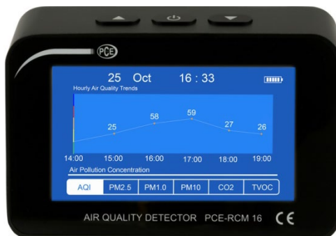
Figura 3 Visualizzazione di un grafico