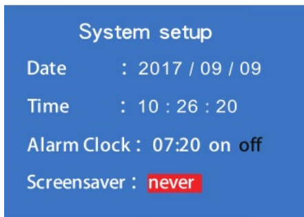
Figura 4 Menu di configurazione

Nota: Il dispositivo può funzionare anche con alimentatore.