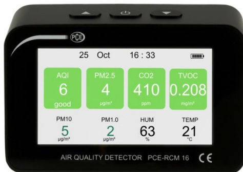
Figura 1 Visualizzazione standard