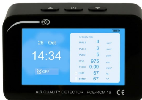
Figura 2 Visualizzazione elenco