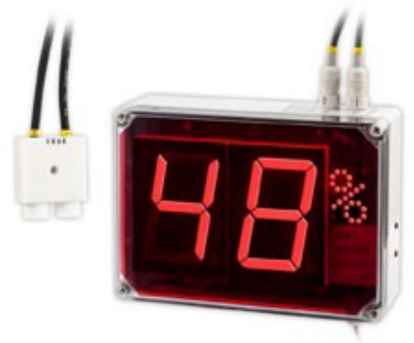
Hygromètre mural PCE-G1