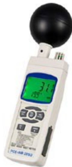
Hygromètre manuel PCE-WB 20SD