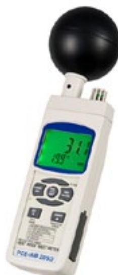
Hand-Hygrometer PCE-WB 20SD