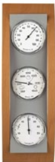
Analog Hygrometer Domatic Buche Alu