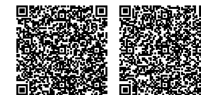
PCE-VT 3800 PCE-VT 3800S