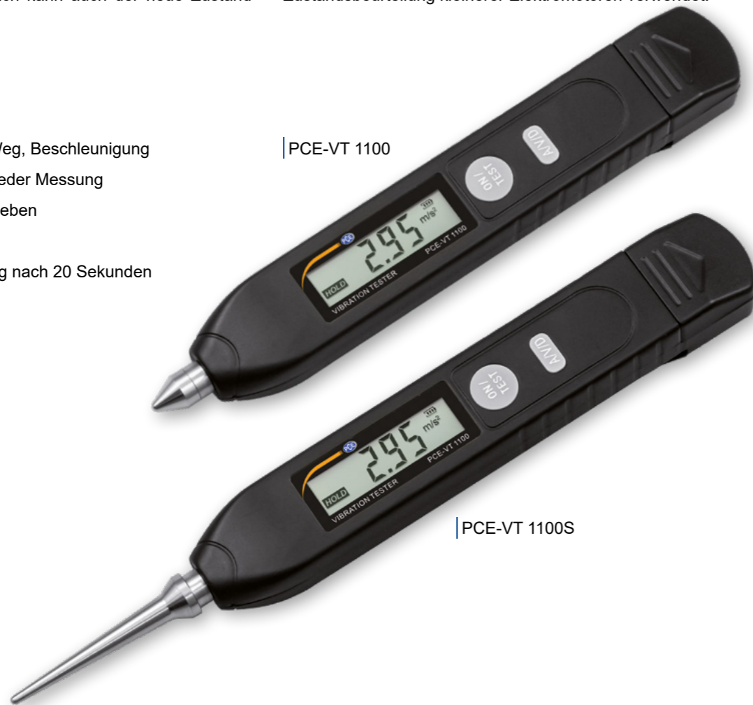
| PCE-VT 1100S