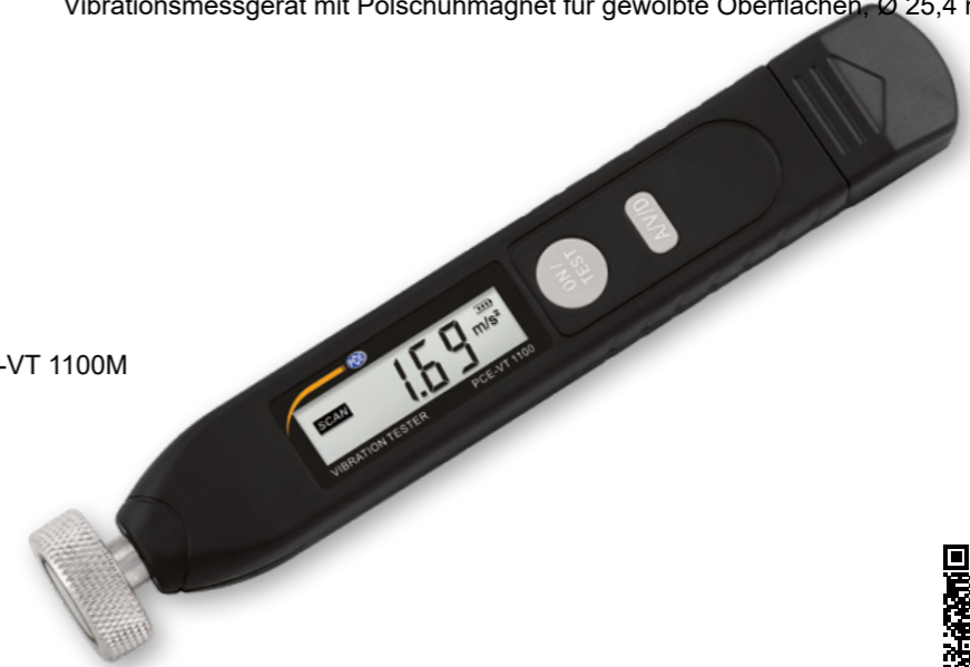
| PCE-VT 1100M