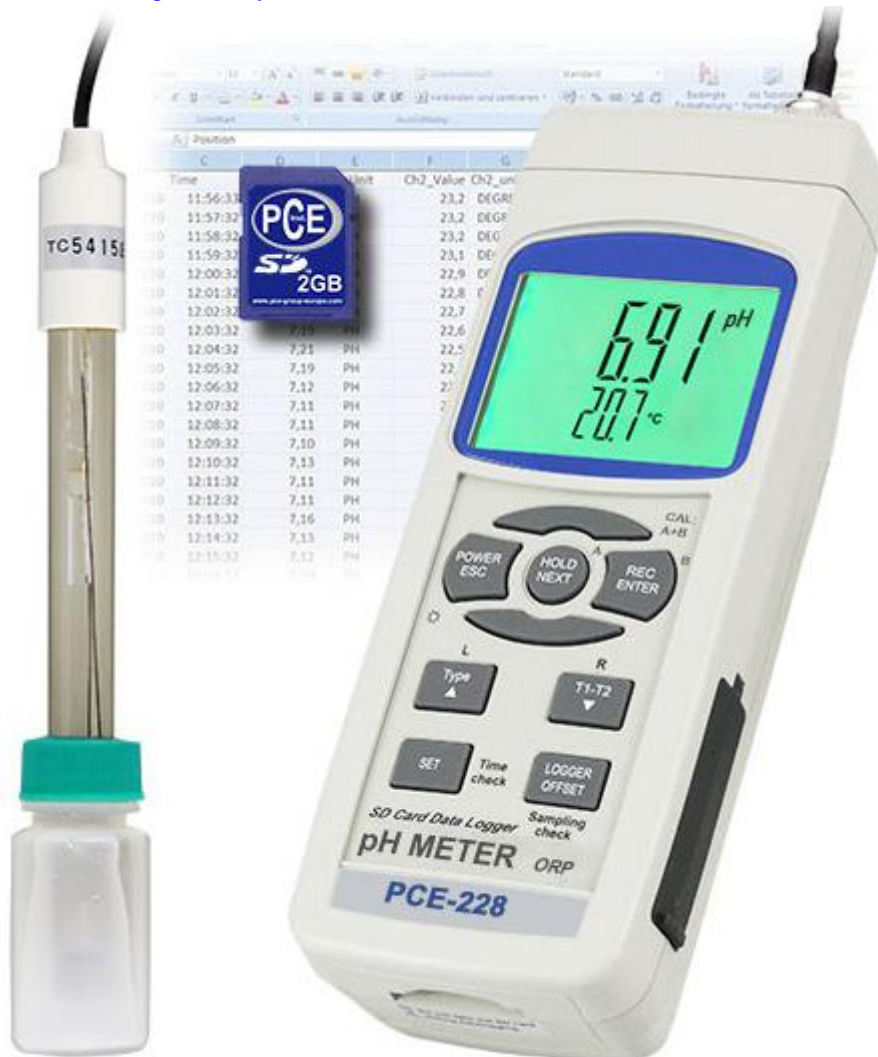
pH-metro PCE-228 con electrodo de pH PE 03