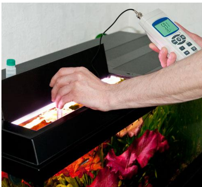
Imagen de uso del pH-metro