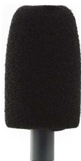
Conjunto protector lluvia y pantalla antiviento