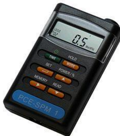
Medidor de radiación solar PCE-SPM 1