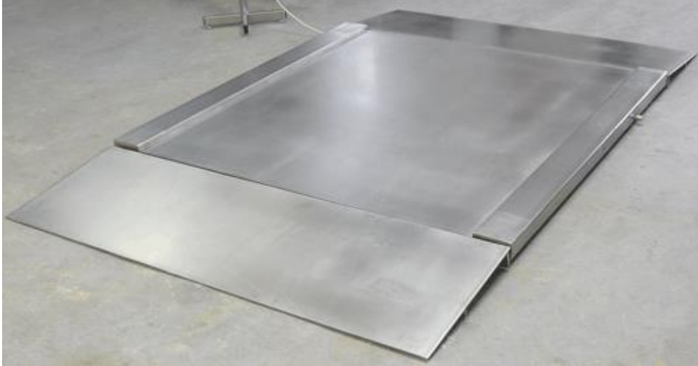
Imagen de la balanza de suelo de acero inoxidable con dos rampas. La segunda rampa de acceso de acero inoxidable es opcional (ver los accesorios)