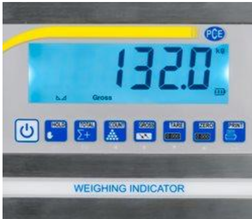
Beeldscherm van de Palletweegschaal (afneembaar)