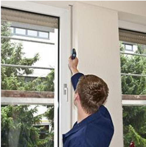
De contactloze thermometer in de praktische toepassing op ramen.