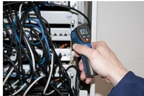
Hier ziet u de contactloze thermometer bij gebruik in een meterkast.