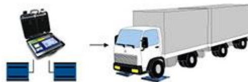
Wielweging met Weegbrug