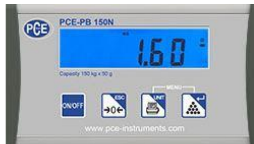
Beeldscherm van de USB pakketweegschaal van de serie PCE-PB N