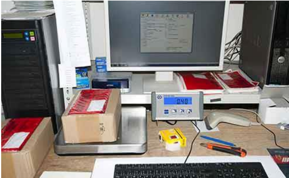
Aansluiting van de USB pakketweegschaal op de verzendsoftware van GePard / EasyLog / DHL. De consultopdracht van de USB pakketweegschaal is Sx.