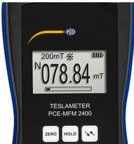
Display van de stralingsmeter