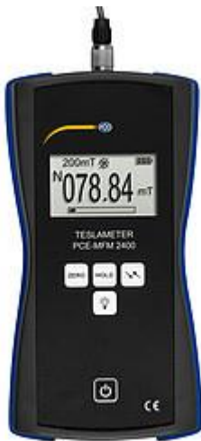
Voorzijde van de stralingsmeter