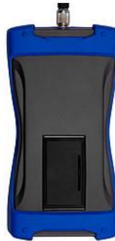
Achterzijde van de stralingsmeter