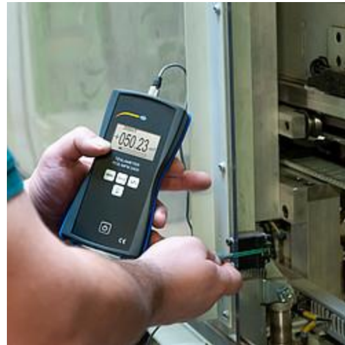
De stralingsmeter in gebruik