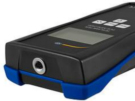
Zijkant van de stralingsmeter