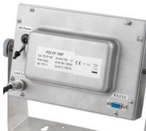
Achteraanzicht van het display van de platform weegschaal serie PCE-EP met RS-232-interface