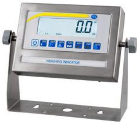
IP54 beeldscherm van platform weegschaal met verlicht LCD display