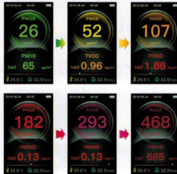
Kleurenindicatie van de luchtkwaliteit

Na het inschakelen toont het display in het midden de actuele waarde in de deeltjesgrootte PM 2,5. Buiten de meetwaarde om, wordt de luchtkwaliteit ook door middel van een kleurenindicatie weergegeven: groen (goed), geel (matig), rood (slecht). Onderin het display wordt links de temperatuur en rechts de luchtvochtigheid weergegeven. Bovenin wordt middels het batterijsymbool de batterijstand weergegeven.