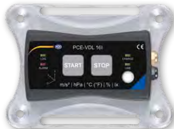
Datenlogger mit optionaler Montageplatte PCE-VDL MNT