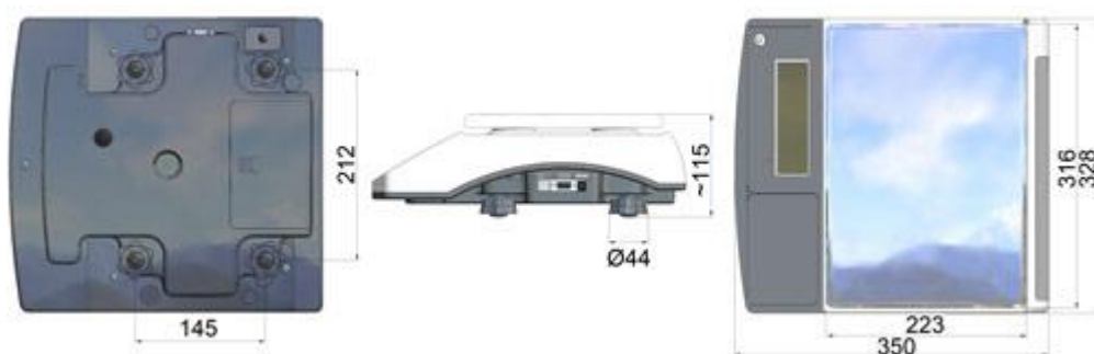
Abmessungen der Systemwaage PCE-TB