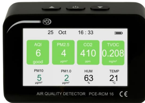
Abbildung 1 Standardansicht