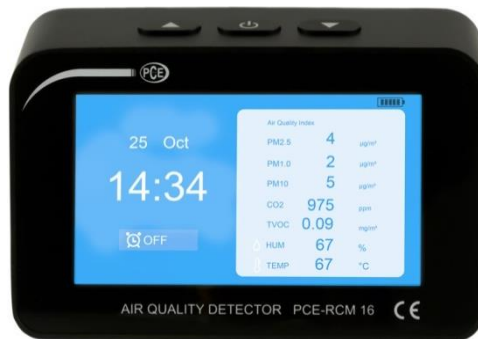
Abbildung 2 Listenansicht