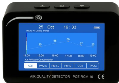
Abbildung 3 Grafikanzeige