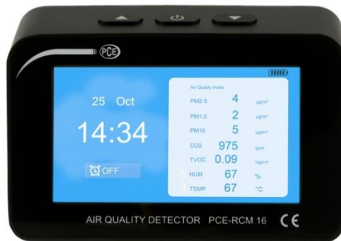
Abbildung 2 Listenansicht