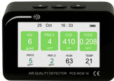
Abbildung 1 Standardansicht