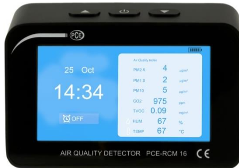
Abbildung 2 Listenansicht