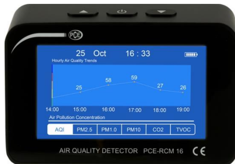
Abbildung 3 Grafikanzeige