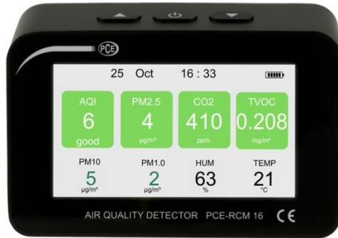
Abbildung 1 Standardansicht