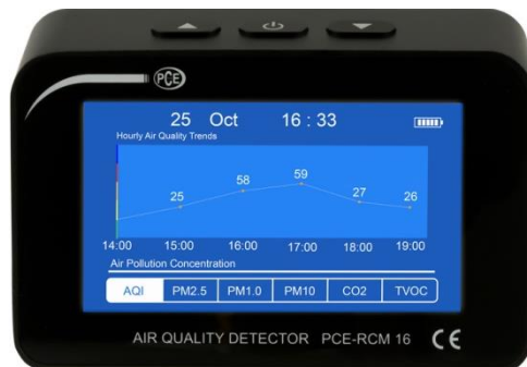
Abbildung 3 Grafikanzeige