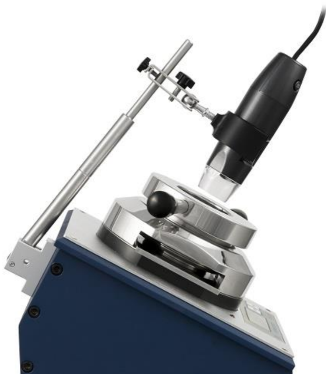
Befestigung des USB-Mikroskopes