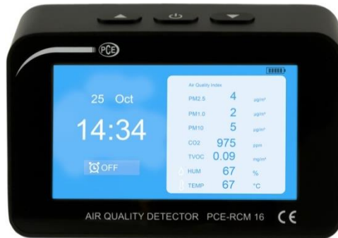
Abbildung 2 Listenansicht