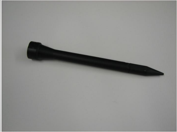
Richtrohr mit Spitze