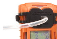
Platte für Bump-Test / Kalibrierung Zur Beaufschlagung des T4 mit Prüfgas

Aufsteckbarer Filter für staubige Umgebungen