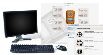
NEU Portables Pro 2.0 Software Einfache Konfiguration und Wartung

Effektives Laden und Aufbewahrung während der Fahrt