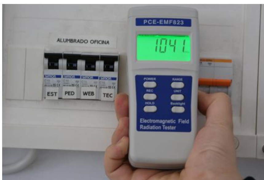
Comprobación de la radiación magnética en un cuadro eléctrico con el gaussímetro.